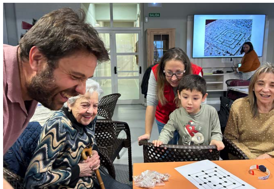
Taller sobre los juegos en Cascantum