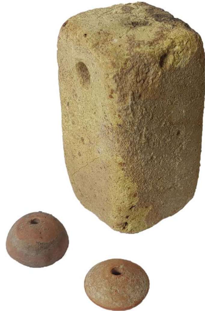
Pondus y fusayolas romanas.

El esfuerzo que esta producción artesanal requería nos muestra la importancia económica que llegó a tener el textil. Si comparamos los métodos de fabricación romanos con elementos actuales podemos entender mejor esta importancia. Para la fabricación de un pantalón vaquero con un sistema de hilado y tejido romano serían necesarios 10 kilómetros de hilo y 227 horas de trabajo (28 días, una persona) y para hacer un juego de sábanas los números son aún más llamativos, serían necesarios 47 kilómetros de hilo y 1068 horas de trabajo (134 días, una persona).