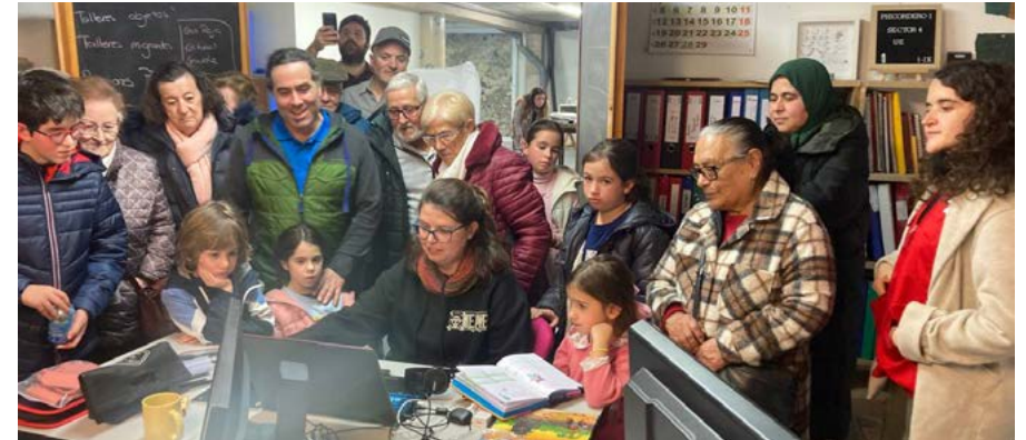
Visita de los participantes “Los objetos de la memoria” al Centro Arqueológico Cascantum.

la materialidad, podemos tocar con nuestras propias manos. Esto nos permite pensar en las realidades que vivieron las personas que nos precedieron.