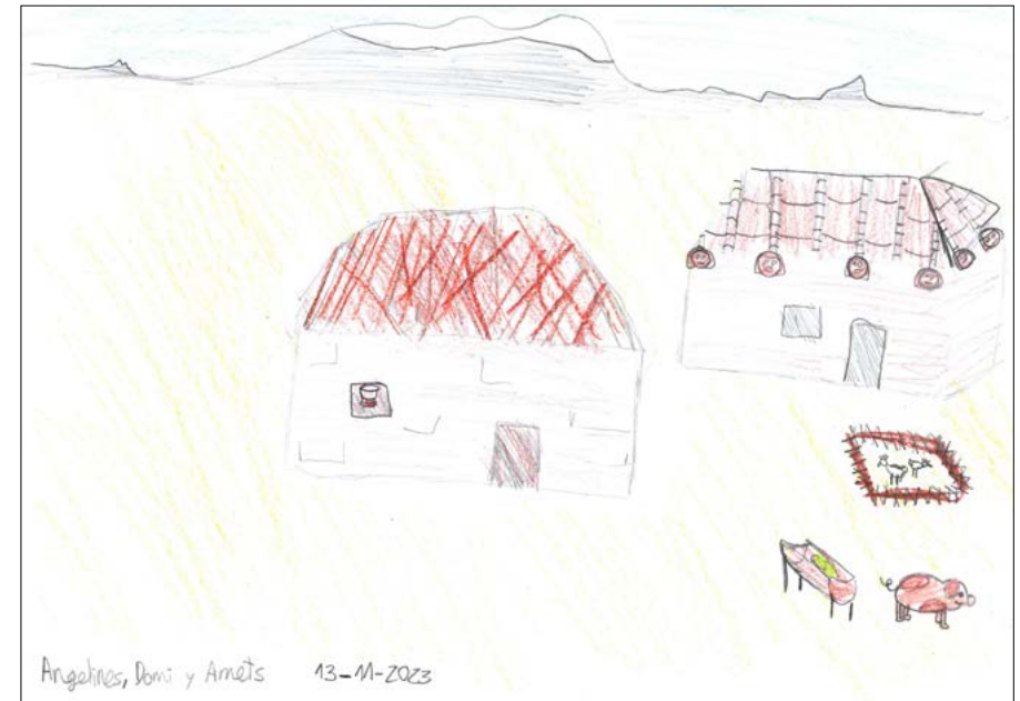
Dibujo realizado por varias de las participantes del taller “Casas en Cascantum”

Mientras les hablábamos de los sistemas de calefacción de las grandes casas romanas recordaban el frío que pasaban en sus casas cuando eran niñas, en las que el hogar, la cocina económica y los braseros eran, muchas veces, el único punto de calor de la casa.