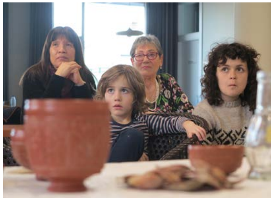
Participantes de los talleres “Los objetos de la memoria”.

Una realidad de nuestro tiempo es la problemática de la soledad no deseada provocada por el envejecimiento de la población. Crear espacios seguros en los que las personas puedan sentirse cómodas y protagonistas es lo que nos llevó a poner en marcha los talleres intergeneracionales de “Los objetos de la Memoria”. A través de la didáctica del objeto tratamos de utilizar como excusa la arqueología para poder encontrarnos, compartir saberes y recuperar la memoria. La arqueología es una ventana a un pasado que, a través de