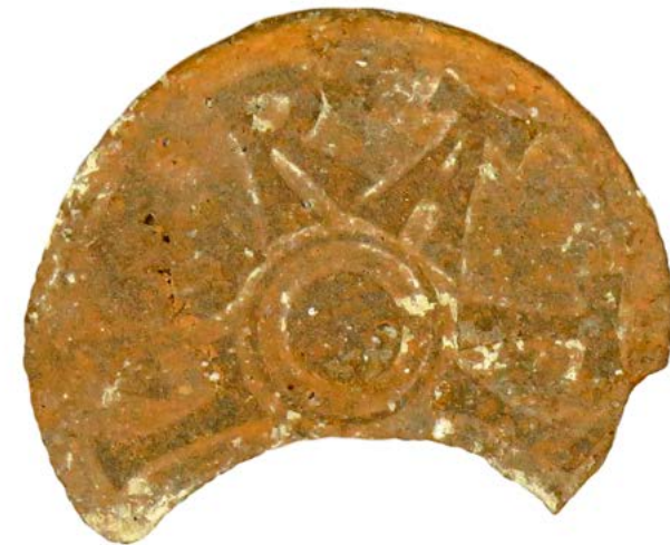
Graffiti y sello de los Gratios procedentes de Picordero I.