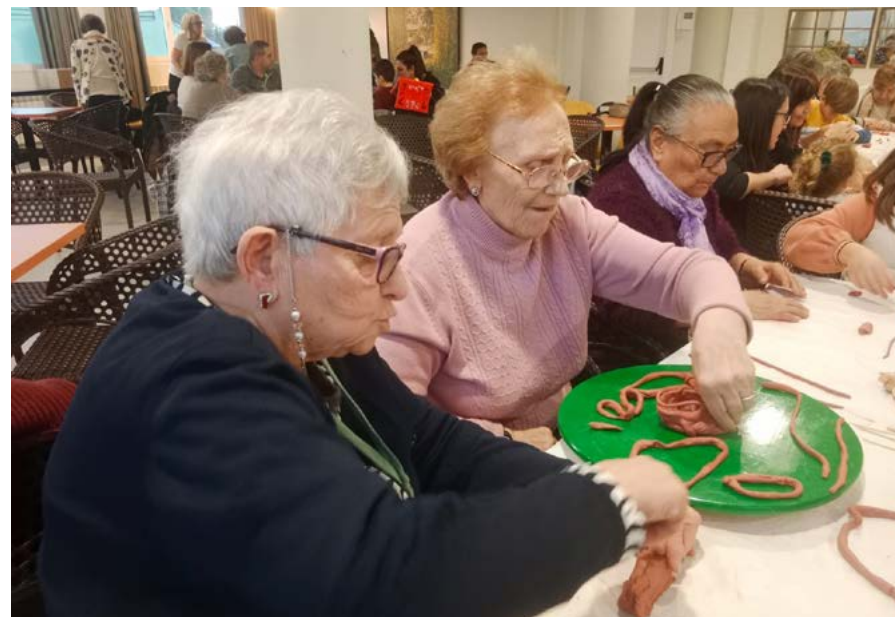
Taller sobre la artesanía romana en Cascantum.