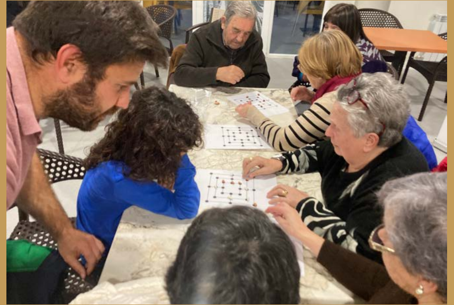
Taller sobre los juegos en Cascantum.