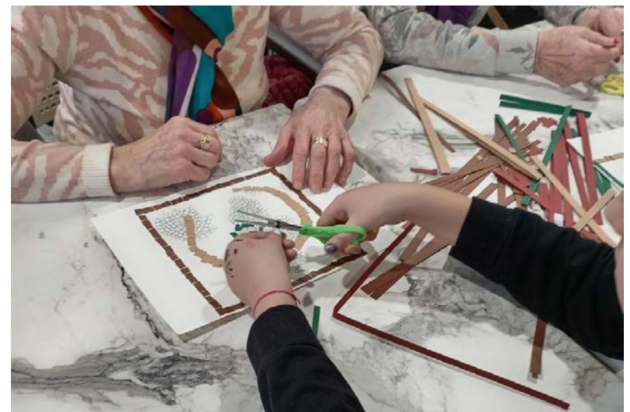
Taller sobre la agricultura en Cascantum