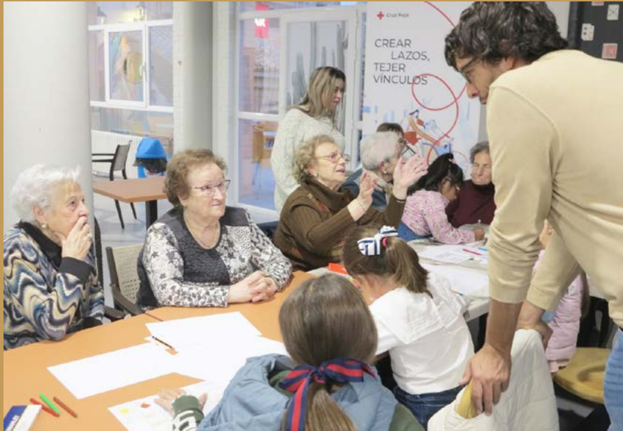
Taller "Casas en Cascantum."