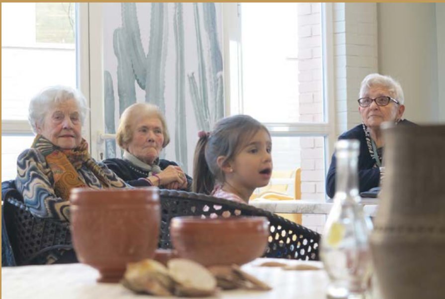
Taller sobre el artesanado en Cascantum.