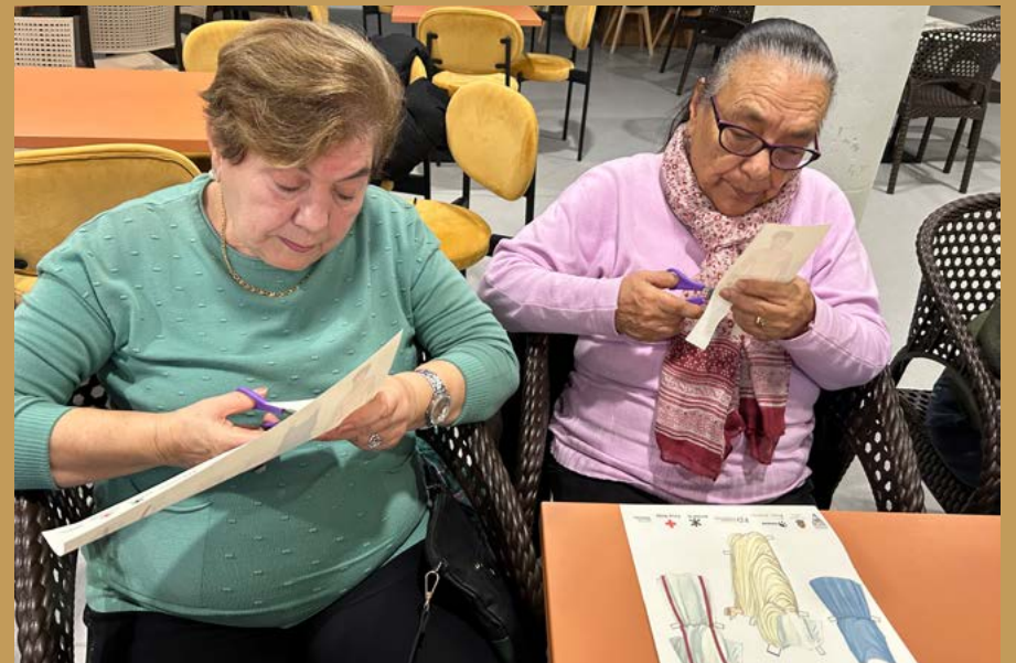
Taller sobre los juegos en Cascantum.