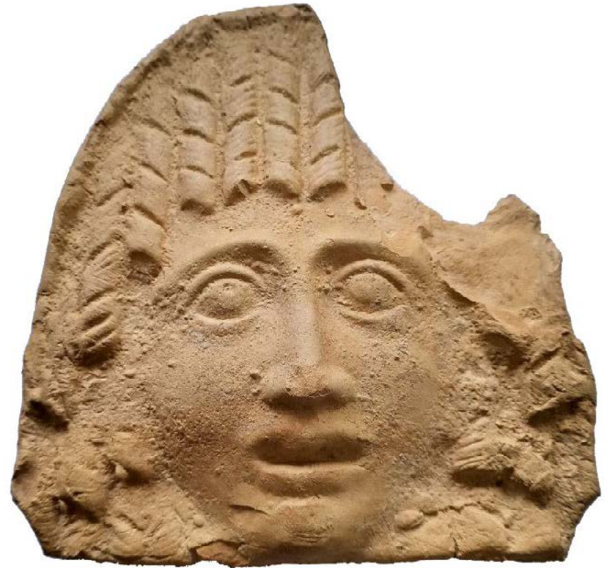
Antefija de la villa Piccordero I.

La gran mayoría de personas no vivían en casas lujosas como las excavadas en el Romero, sino que vivían en casas muy humildes, levantadas con zócalos de cantos de río trabados con tierra o mampuestos de arenisca, sobre ellos se levantaban muros de adobe y sus tejados eran de cañizos con barro. Los suelos no tenían mosaicos, sino tierra apelmazada pintada con yeso o cal. Las paredes a su vez estaban encaladas, para desinfectar y sanear la construcción.