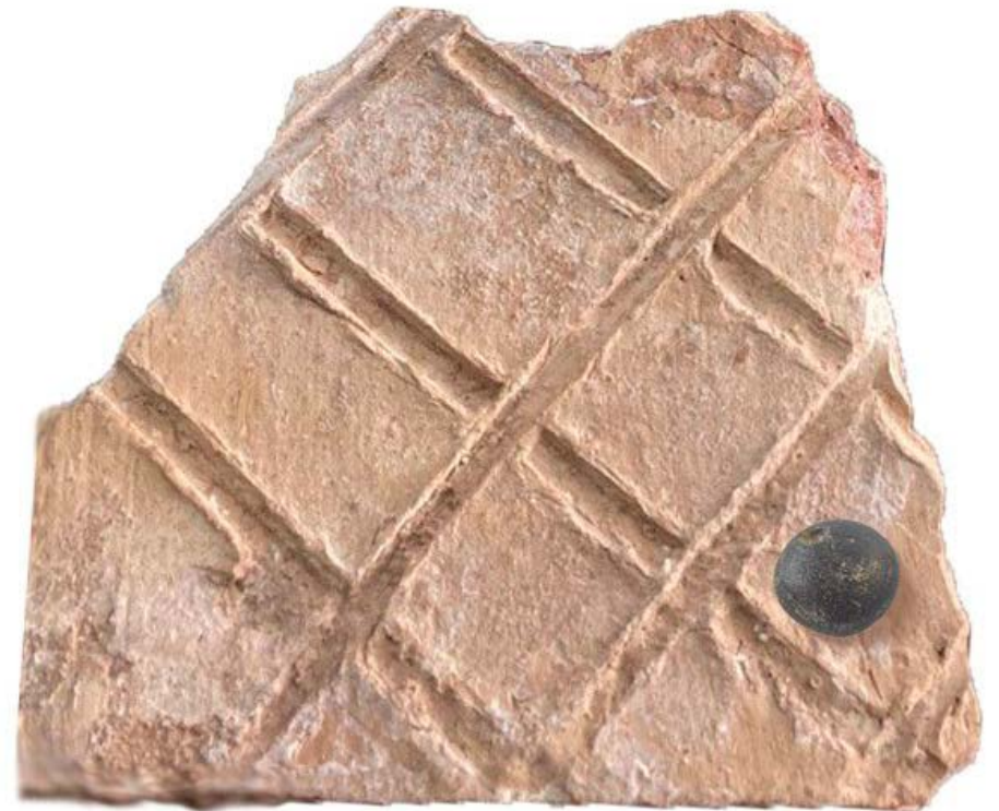
Tablero de juego con ficha de vidrio romana.

Las tabas fue, también, un juego de apuestas muy popular tanto en la infancia como en la edad adulta. Este juego no solo fue popular en época antigua, sino que hasta bien entrado el siglo XX en las calles de Cascante se seguía jugando.