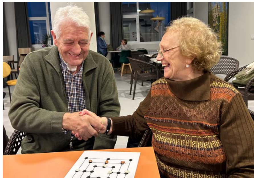
Dos asistentes con un tablero de molino.