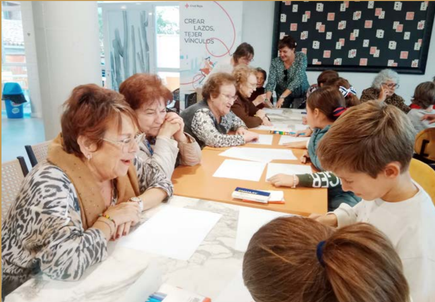
Participantes del taller sobre las casas en Cascantum.