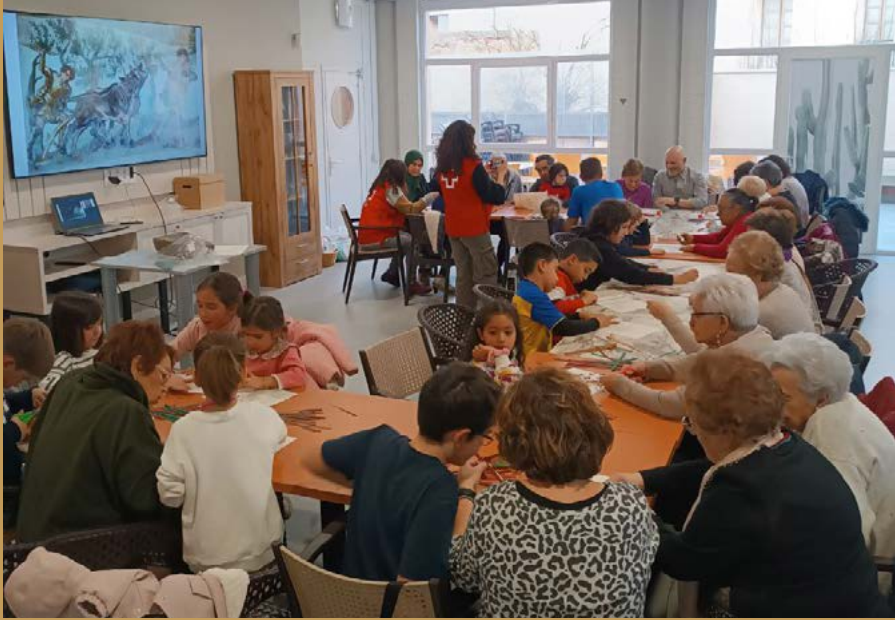
Taller sobre la agricultura en Cascantum.