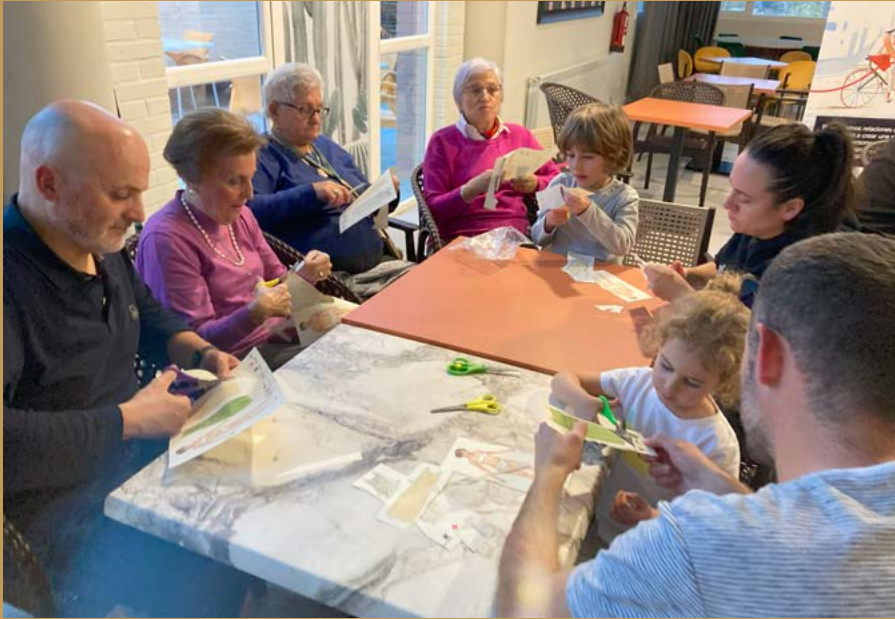
Taller sobre los juegos en Cascantum.