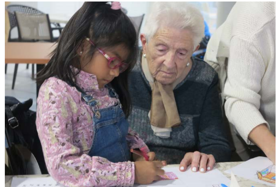
Participantes en el taller “Las casas”