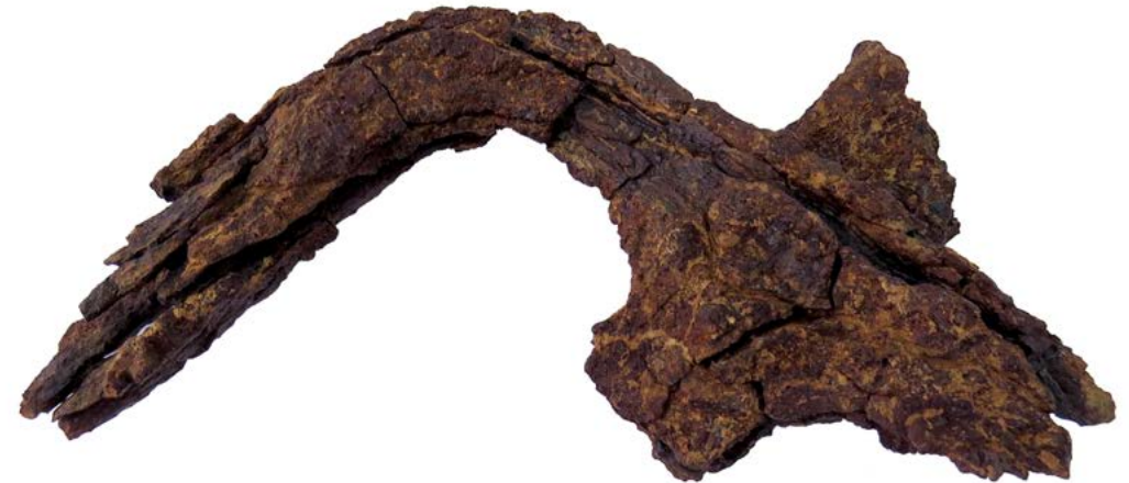
Arado romano de vástago procedente de Picordero I.

Gracias a las investigaciones en Picordero, no solo hemos podido conocer las especies vegetales y animales que estaban presentes en el campo romano, además, hemos estudiado las herramientas de labranza que utilizaron para cultivar las tierras de nuestro entorno cercano. En Picordero apareció un arado de hierro que se ha convertido en una herramienta fundamental para el estudio de la agricultura en la Hispania romana.