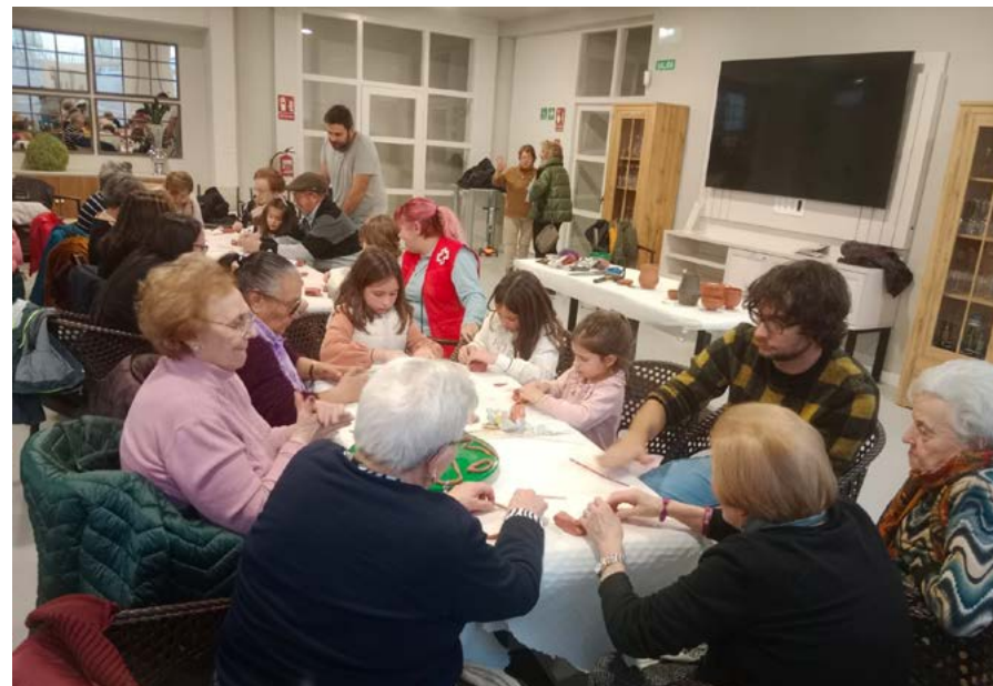
Taller sobre la artesanía romana en Cascantum.

También hubo industrias vinculadas a la producción agraria, en particular a la elaboración de aceite y a la fabricación de harinas y pastas. El caso de los trujales es importante, aunque los más antiguos, en los que muchos hombres trabajaron durante décadas, ya hayan desaparecido o se encuentren en ruinas. Hoy en Cascante y su entorno sigue habiendo nuevos trujales que mantienen viva una actividad que al menos desde época romana fue fundamental para la ciudad.