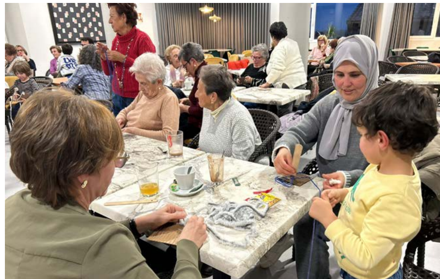
Participantes en el taller “Los textiles”.

Los hilos, algodones, lanas y telas para estas actividades cotidianas se compraban en los comercios que se distribuían por las calles centrales de Cascante. Todos estos comercios hoy no existen, pero podemos ver algunas de sus huellas en algunas fachadas.