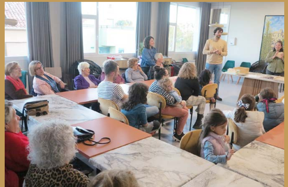
Taller "Casas en Cascantum."