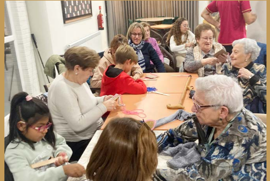
Niñas y personas mayores en uno de los talleres.