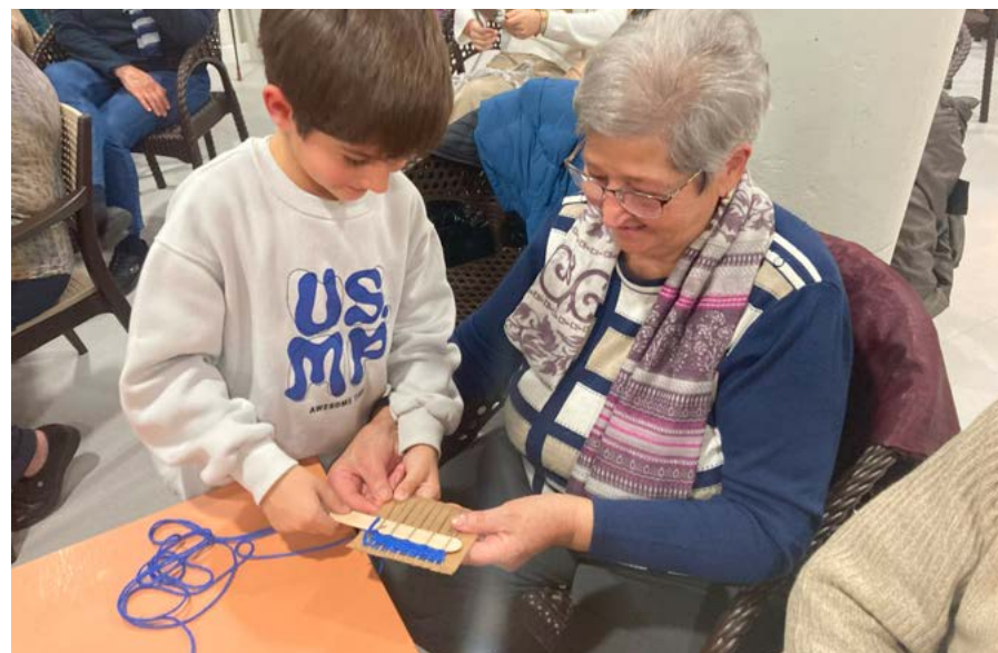
Abuela y su nieto en el taller sobre los textiles en Cascantum.