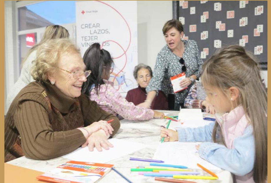
Taller "Casas en Cascantum."