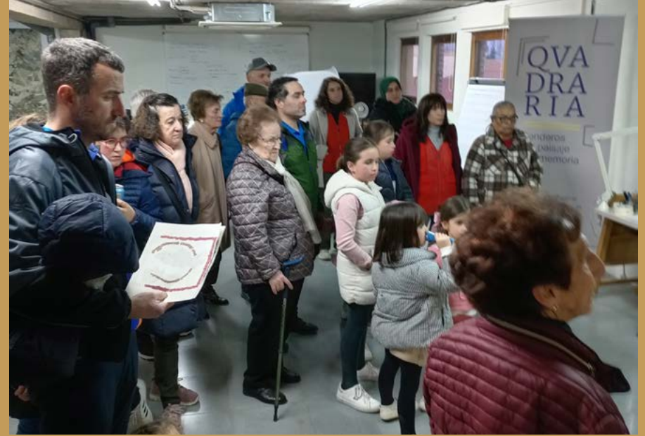
Visita de los participantes "Los objetos de la memoria" al Centro Arqueológico Cascantum.