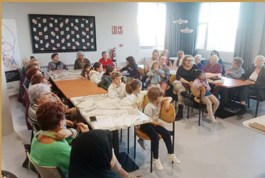
Taller sobre el textil en Cascantum.