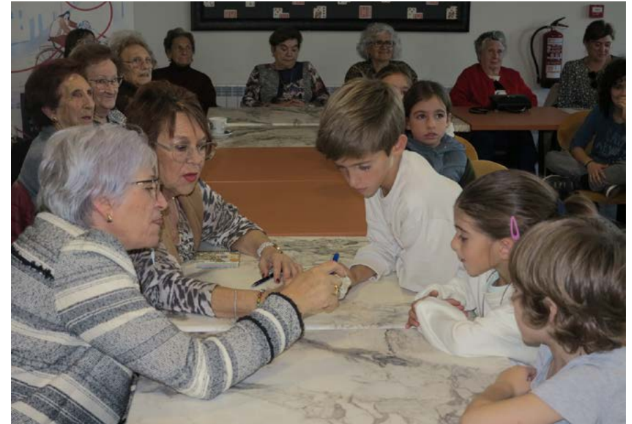
Personas mayores, niñas y niños en uno de los talleres.