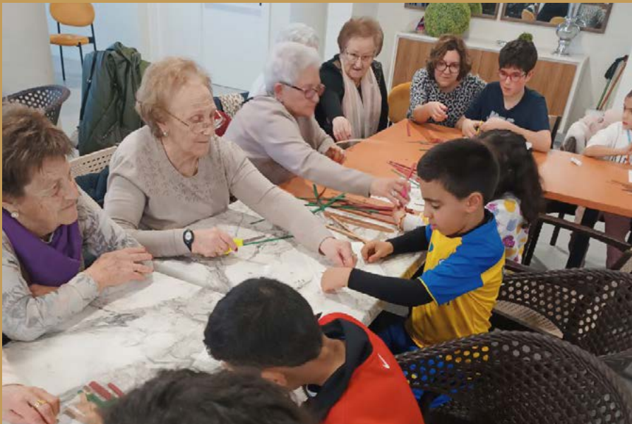
Taller sobre la agricultura en Cascantum.