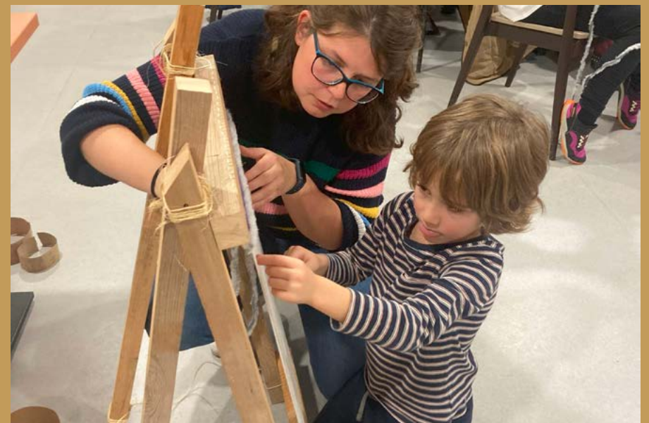
Taller sobre el textil en Cascantum.