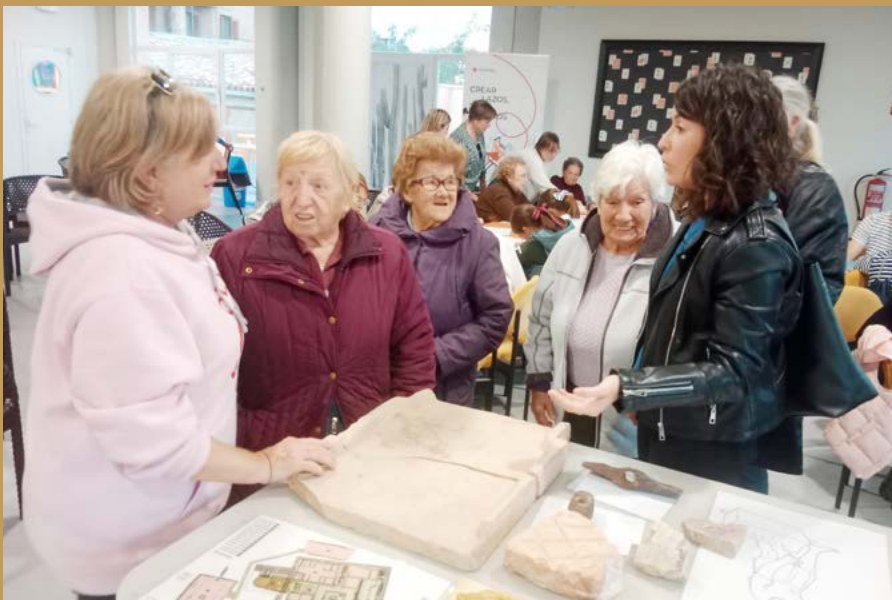
Varias mujeres en el taller sobre las casas en Cascantum.