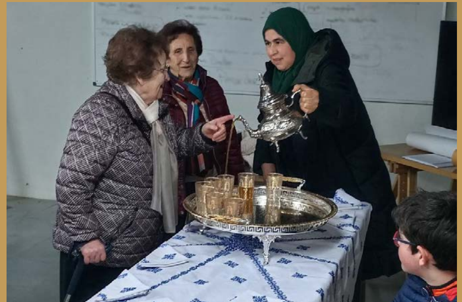
Visita de los participantes "Los objetos de la memoria" al Centro Arqueológico Cascantum.